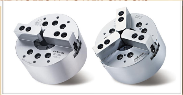
寸法図 >> Dimensions